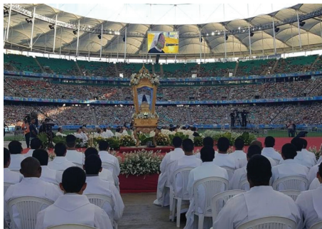
Nossa Senhora Aparecida- Doação de alimentos