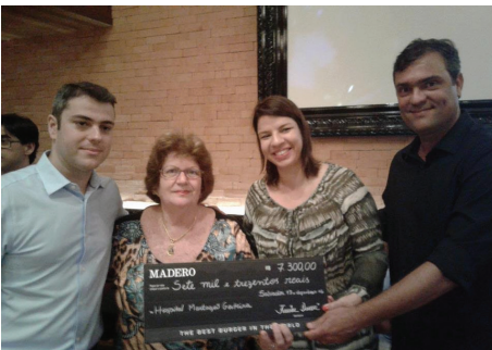
Jantar Beneficente da inauguração do Restaurante Madero