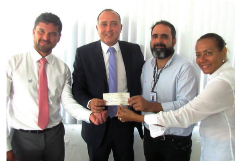
Doação da CAAB (Caixa de Assistência dos Advogados da Bahia)