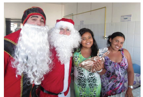
Visita do ator Wagner Moure e grupo voluntários para distribuição de brinquedos no Natal