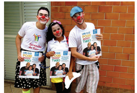
Ação voluntária do grupo Semente do Riso para a campanha Um Dia Pode Mudar Tudo