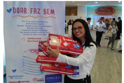
Doação de fraudas no evento CONSAD