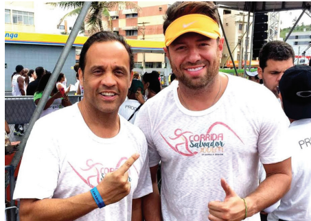
Corrida Salvador Jovem