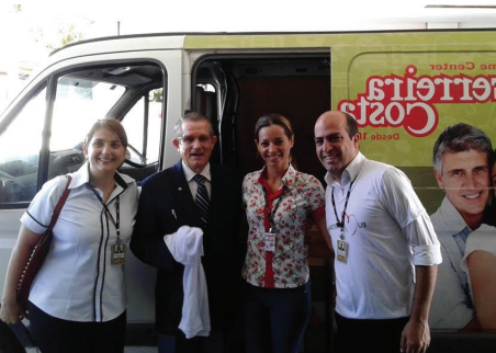
Doação de toalhas e lençóis pela Ferreira Costa