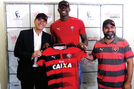
Assinatura do contrato de parceria com o Esporte Clube Vitória