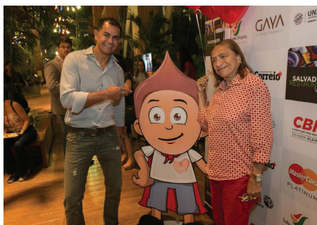
Salvador Restaurante Week