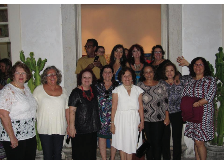
Exposição de obras A Vida é Bela em prol do Hospital Martagão Gesteira